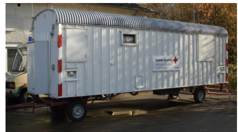
Seit 24 Jahren im Dienst: Die mobile Sanitätswache des DRK OV Pforzheim.

Durch die zahlreichen Einsätze und nach über 20 Betriebsjahren muss unsere Sanitätswache ersetzt werden. Das bewährte Konzept des Anhängers soll beibehalten werden. Die medizinische und technische Ausrüstung muss jedoch ebenfalls teilweise neu beschafft werden.